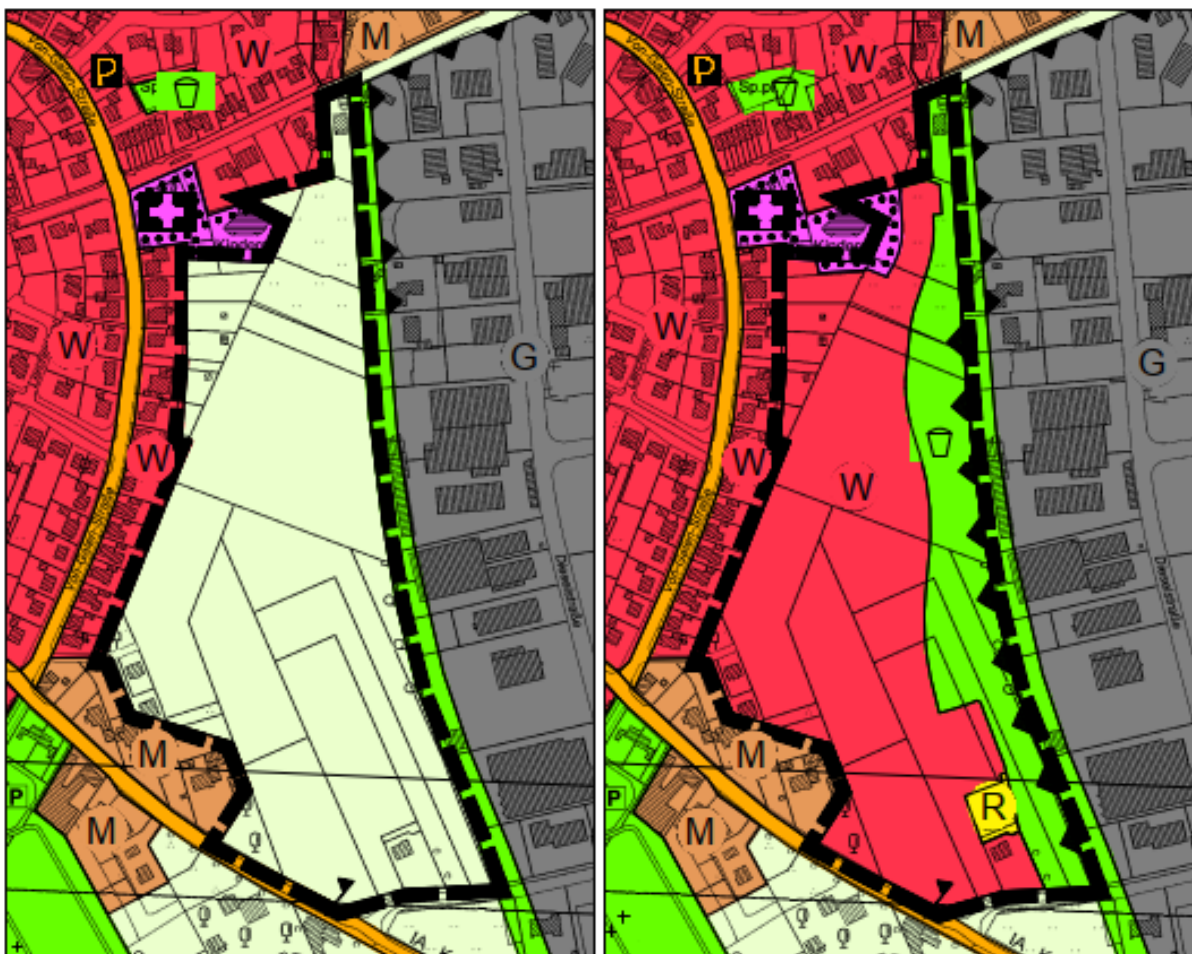
Abbildung 1: Vorher / nachher Darstellung Teilbereich A, o. M.

Innerhalb des Teilbereiches A sind rd. 4,7 ha bereits real durch die bestehende Gärtnerei baulich genutzte Fläche, sodass die neu in Anspruch genommene Fläche im Teilbereich A nur noch rd. 4,15 ha ausmacht.