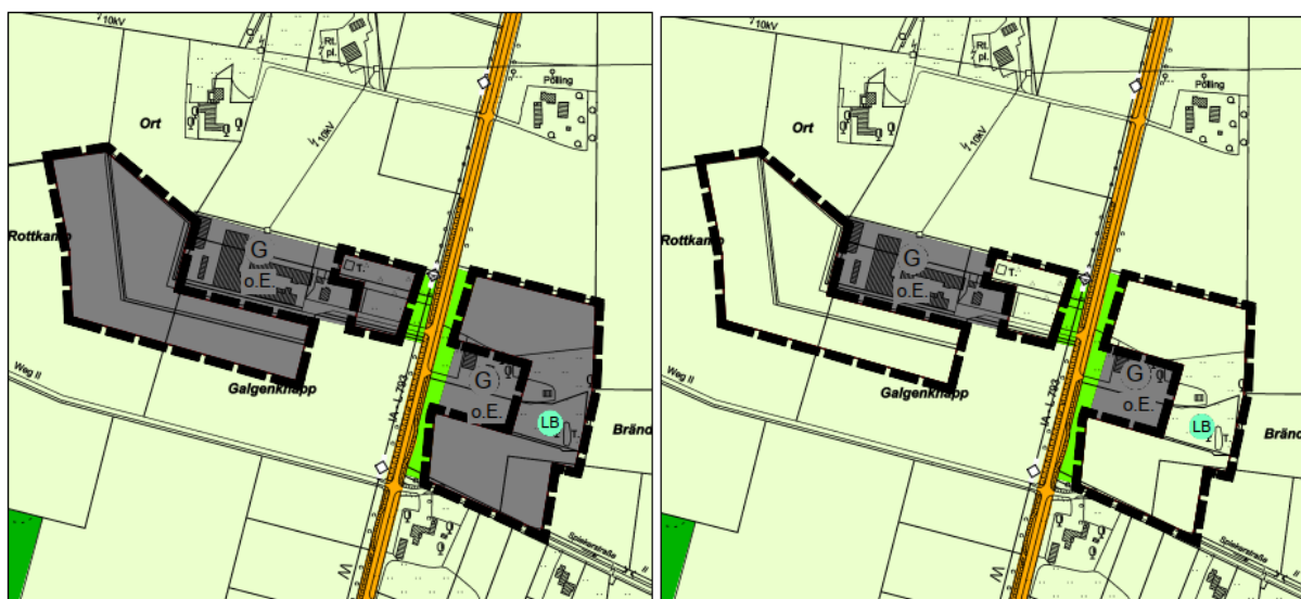
Abbildung 2: Vorher / nachher Darstellung Teilbereich B, o. M.

Der Umfang der Überkompensation soll bei anderen Flächenentwicklungen als Ausgleich in Anspruch genommen werden.